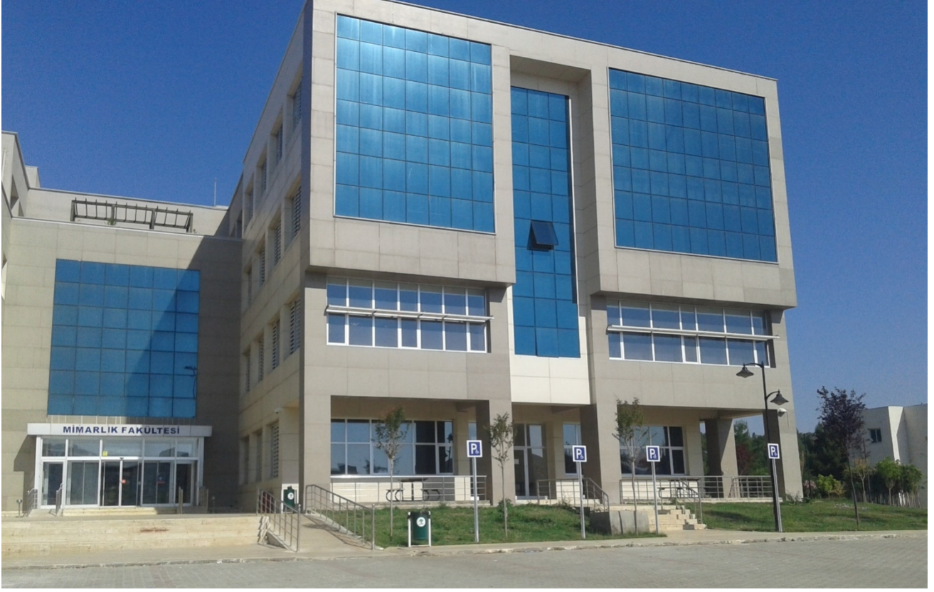
Şekil 1. Mimarlık Fakültesi Binası