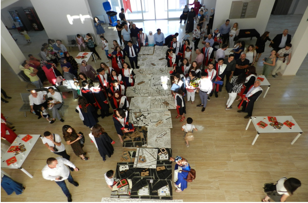
Şekil 3 Mimarlık Bölümü Bitirme Projesi Sergisi