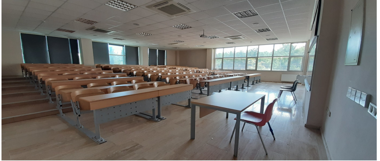
Şekil 2. Mimarlık Fakültesi 128 Kişilik Sınıfı

Şekil 2 de Mimarlık Fakültesi sınıflarından birisine ait fotoğraf verilmiştir. Mimarlık Fakültesinde bulunan sınıflar ve kapasiteleri Tablo 1A da verilmiştir. Sınıflar Havacılık ve Uzay Bilimleri Fakültesi ile birlikte kullanılmaktadır.